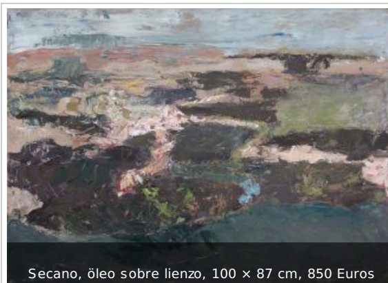
Secano, óleo sobre lienzo, 100 x 87 cm, 850 Euros